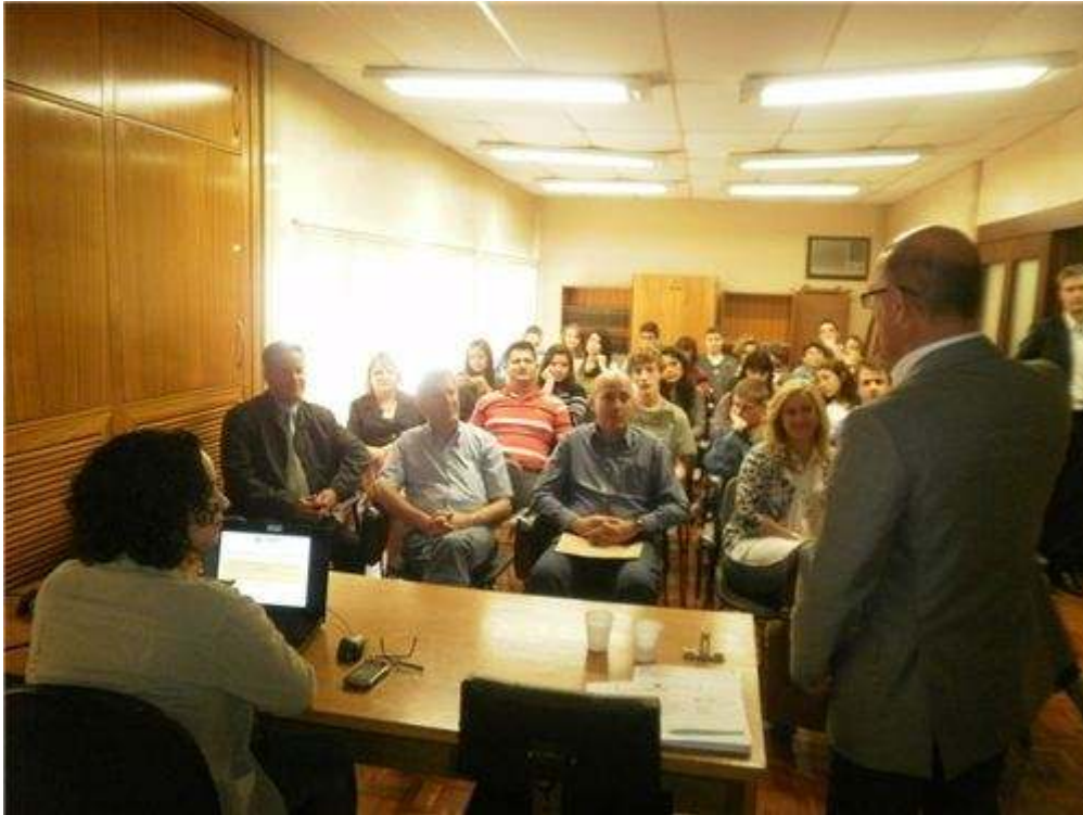
Câmara Juvenil de Guaporé com autoridades do município

Revista Estudos Legislativos 2013 - Ano 7 Inclui a seção temática Educação para a Democracia