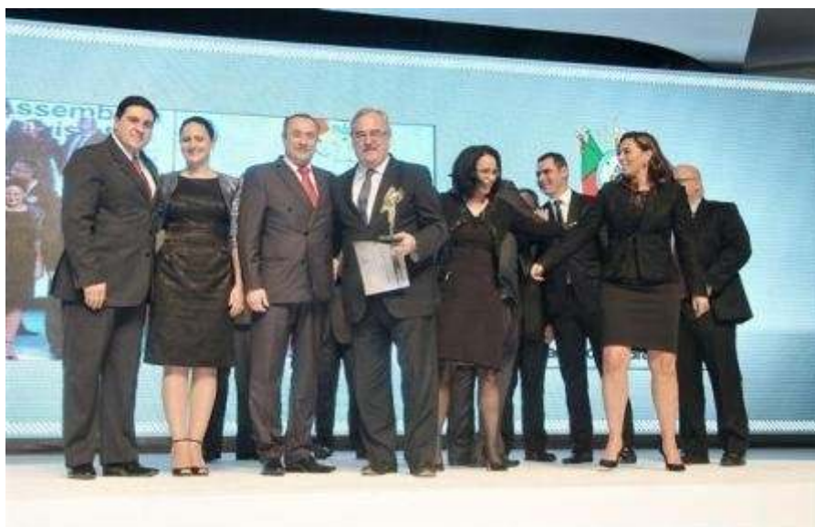
Solenidade do TOP Cidadania ABRH-RS 2013