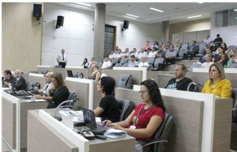
Oficina Interlegis - Novo Hamburgo

Pelo programa Interlegis do Senado Federal, a Assembleia Legislativa promoveu a oficina Nova Legislatura, dia 25 de fevereiro, na Câmara Municipal de Novo Hamburgo. Entre as videoconferências promovidas, houve a palestra Escola de Qualidade Igual para Todos – Federalização da Educação é a Solução?, realizada pelo senador Cristovam Buarque, em abril. A coordenação do Interlegis ainda promoveu reuniões com vistas a renovar termos de adesão ao programa com Câmaras de Vereadores ou realizar parcerias.