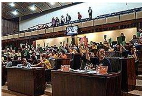
Sessão Plenária do Estudante - Novembro

Participantes da 41ª e 42ª edições do Deputado Por Um Dia: 1.260