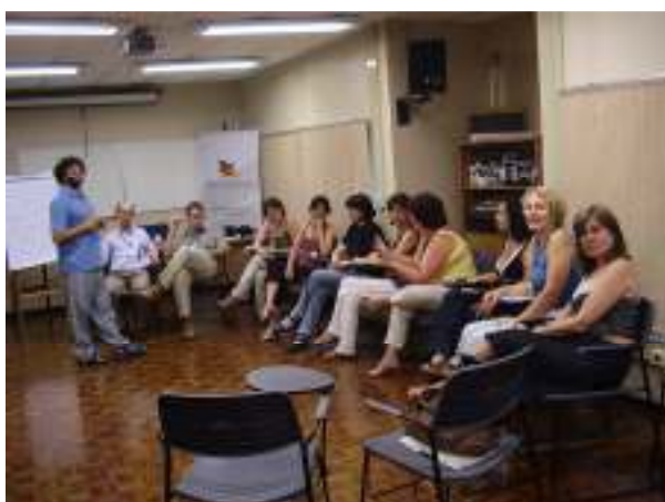
Seminário de avaliação de 2006 e planejamento de 2007 - 14 e 15/12/2006

Total de participantes nas atividades da Escola do Legislativo: 12.111.