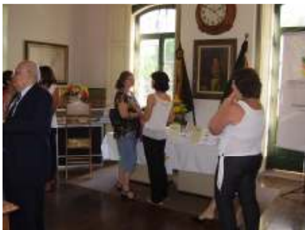
Lançamento do volume 2 da Estudos Legislativos e de O Pensamento de Dyonélio - 12/12/2006

Programa de Capacitação Profissional: 866 participantes.